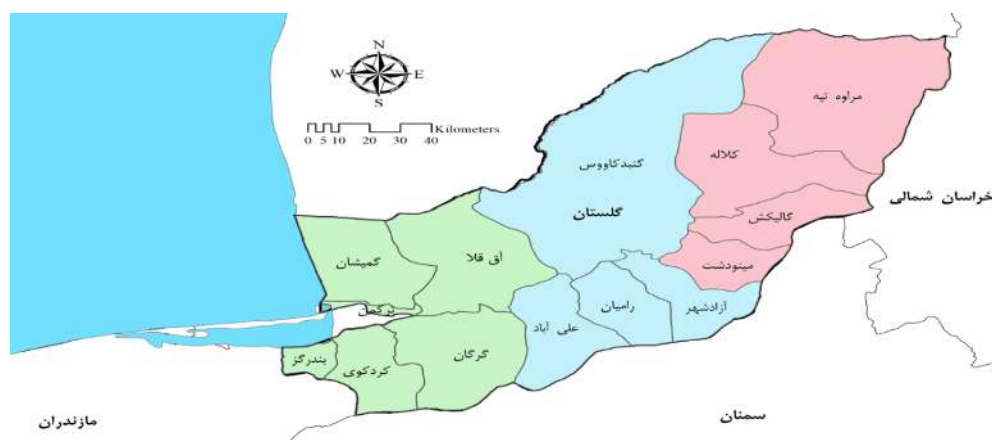
نگاره ۲- نقشه منطقه مورد مطالعه