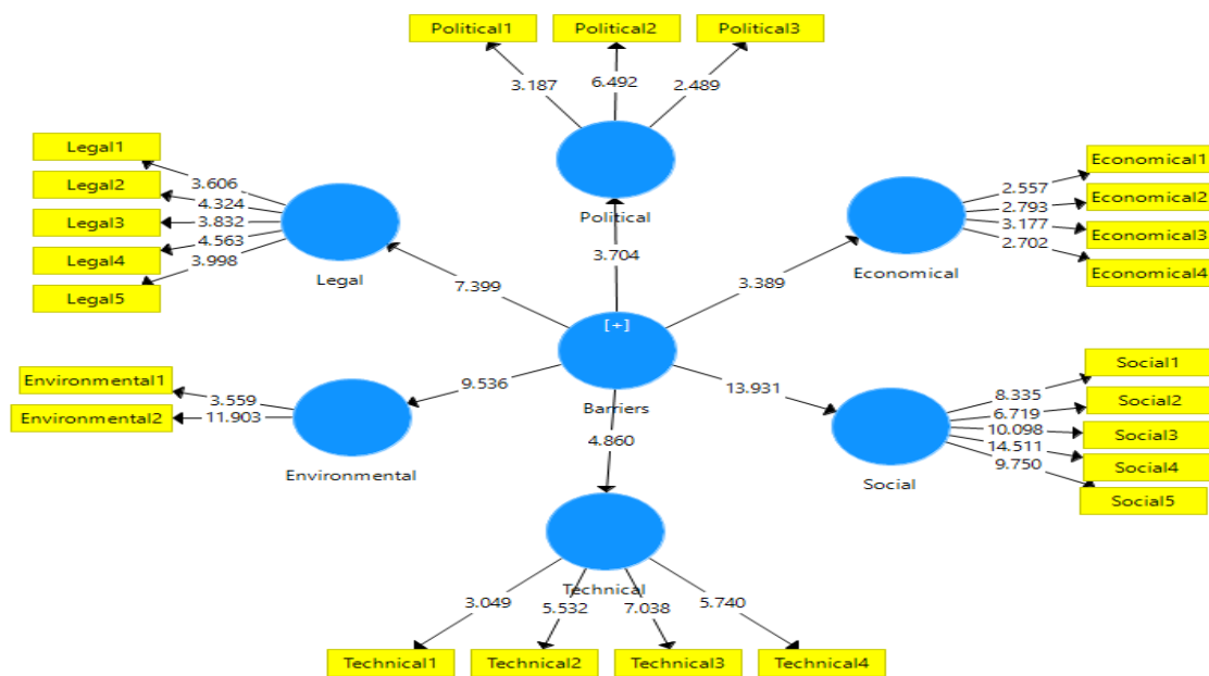
نگاره ۴- مقادیر آماره t مدل چالش‌های کارآفرینی سبز