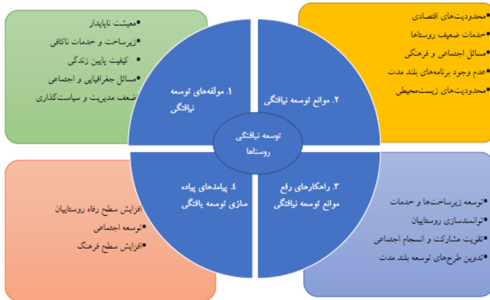
نگاره ۲- مدل مفهومی نهایی پژوهش