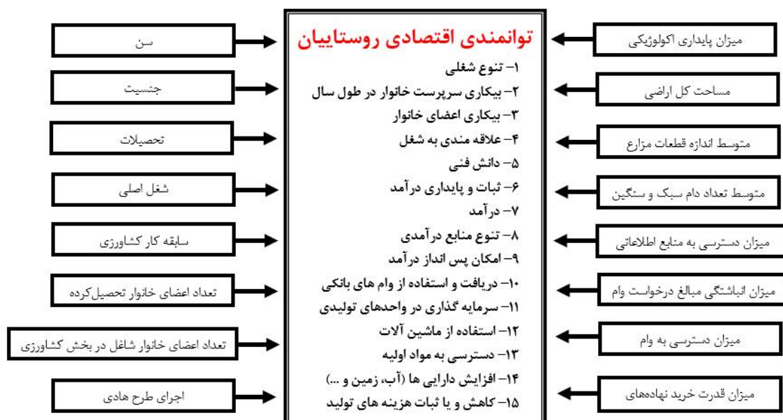
نگاره ۱- چارچوب مفهومی پژوهش

اقتصادی- اجتماعی بر توانمندی اقتصادی روستاییان را مورد آزمون قرار دهد. برای این منظور، عوامل مؤثر اخذ شده از مطالعات کتابخانه‌ای شناسایی، جمع‌آوری و به‌صورت چارچوب مفهومی پژوهش حاضر ارائه شده‌اند (نگاره ۱).